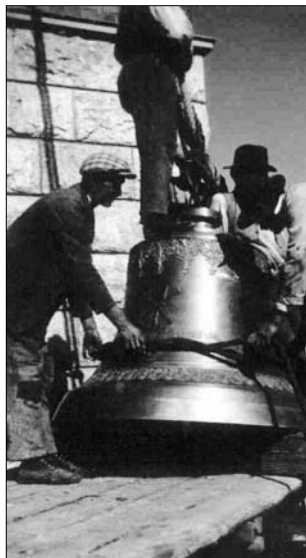
Nový kostol na Legionárskej ul. počas výstavby v rokoch 1932 - 1933