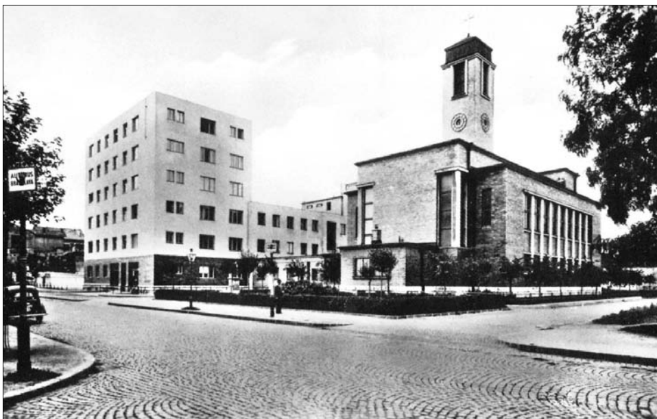
Dobová pohľadnica komplexu Nového kostola a obytného domu na Legionárskej ul.