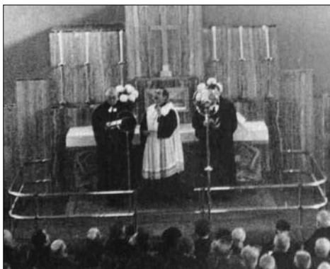
Posviacku Nového kostola na Legionárskej ul. biskupom Samuelom Štefanom Osuským 19. novembra 1933 sprostredkovali ľuďom zhromaždeným pred preplneným kostolom reproduktory