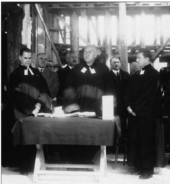
Položenie základného kameňa Nového kostola na Legionárskej ul., jeseň 1932