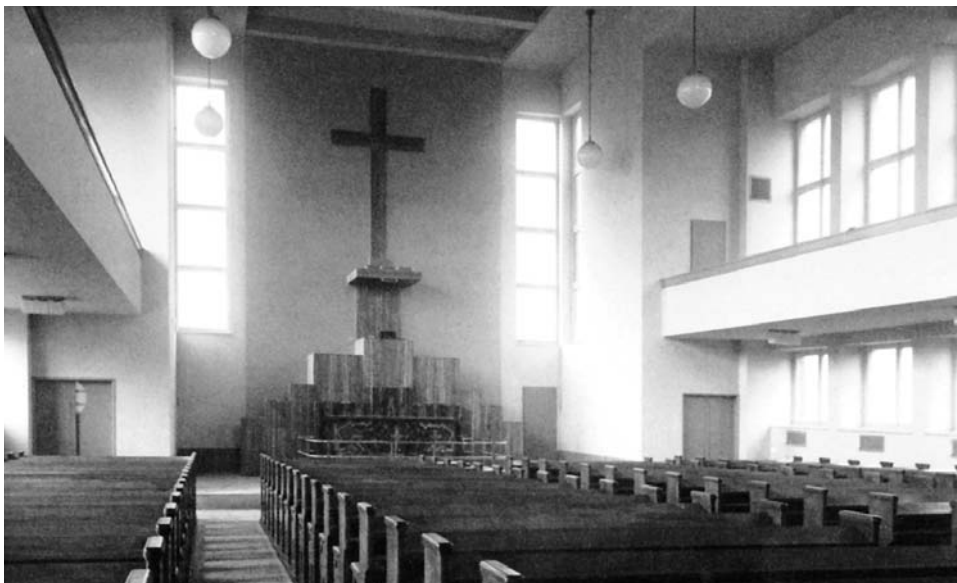
Pôvodný vzhľad interiéru Nového kostola na Legionárskej ul.

Keďže ide o evanjelický kostol, zhromažďovací priestor je pomerne krátky a široký, tvorí takmer štvorec. Rôznou výškou stropu je náznakovito rozdelený na trojlodie. Výškový rozdiel je však iba minimálny, aby sa podľa zásad protestantských kostolov mohla v bočných častiach vytvoriť empora (galéria v sakrálnych priestoroch). Tú nepodopierajú žiadne stĺpy ani piliere, ktoré by bránili výhľadu na oltár. Umožnili to konzoly, na ktorých je empora zavesená. Vďaka železobetónovým nosným pilierom sa mohli vytvoriť veľké okná, ktoré do interiéru prepúšťajú