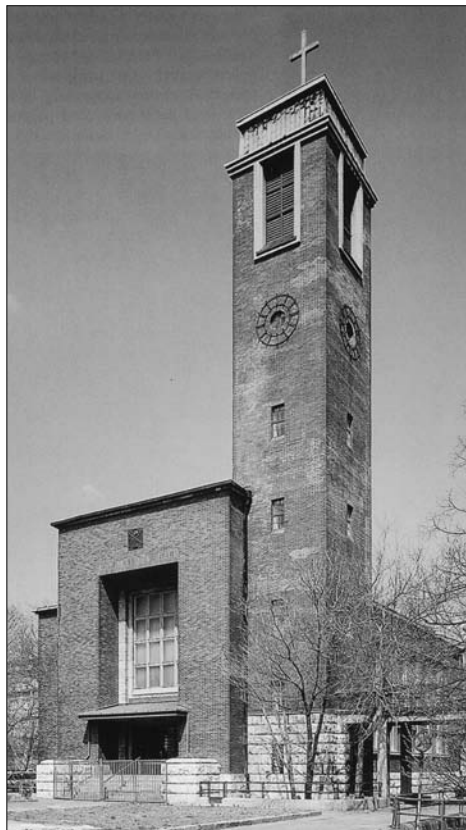
Súčasná podoba exteriéru a interiéru Nového kostola na Legionárskej ul.