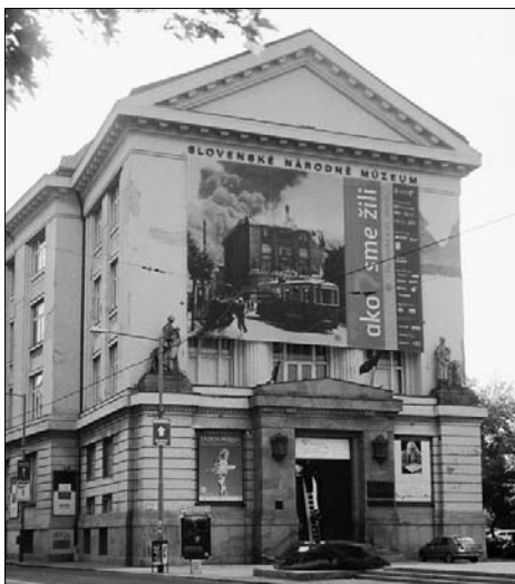
Stavby postavené M. M. Harmincom: Sanatórium Dr. Szontágha v Starom Smokovci (1916), prestavba pohostinstiev U Zeleného stromu a Savoy na prepychový hotel Carlton (1928), budova Tatra banky - dnes Ministerstvo kultúry na Nám. SNP (1925) a Slovenské národné múzeum na Vajanského nábřeží (1928)