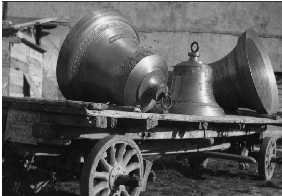
Zvony Nového kostola na Legionárskej ul.

vybratá stavebná firma (Hlavaj – Palkovič – Uličný) a základný kameň kostola bol druhýkrát slávnostne položený 9. 10. 1932. Z pôvodne plánovaného námestia s parkom je zrealizovaná iba časť (Kmeťovo námestie), preto je teraz kostol obrátený hlavným priečelím akoby do dvora, chrbtom k Legionárskej ulici.