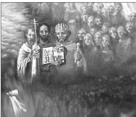
Vierozvestcovia Cyril a Metod s kniežaťom Rastislavom, dolu Ján Hus na hranici

Potom nasleduje slovienska prítomnosť v Európe a príchod vierozvestcov Cyrila a Metoda na Veľkú Moravu r. 863, ktorých zásluhy boli mimoriadne. Priniesli základ pre duchovný život – preklad Novej zmluvy, vytvorili písmo a starosloviencinu presadili ako bohoslužobný jazyk, štvrtý popri hebrejčine, latinčine a gréčtine (akí sme vtedy boli svetoví). Devín, najvýznamnejšie hradisko Veľkej Moravy, v zelenej farbe je predstavený tak, ako ho na základe archeologických vykopávok zrekonštruovali znalci, vedci.