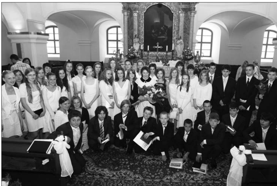
Konfirmácia vo Veľkom kostole 24. 5. 2009