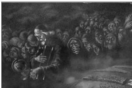
Ján Amos Komenský a žiaľ ľudu, keď opúšťal vlasť