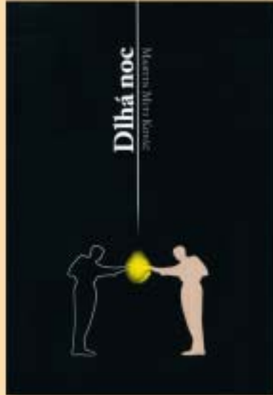
MARTIN MITI KOVÁČ: Dlhá noc Hľadanie odpovedí na životné otázky Cena 2,- €